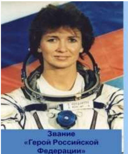
Звание «Герой Российской Федерации»

Так называется выставка в школьной библиотеке, посвященная Международному Женскому Дню 8 Марта. Учащиеся познакомились с биографией женщин - героев разного времени. Например, Ирине Саедер во время Второй мировой войны удалось спасти 2500 детей, которых она вывезла из гетто. В 2013 году она умерла в возрасте 98 лет.