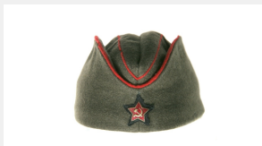
Элементы экипировки красноармейцев